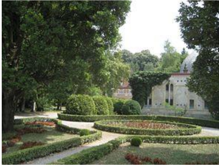
Slika 1. Pogled na Julijev park i Anine blatne kupke