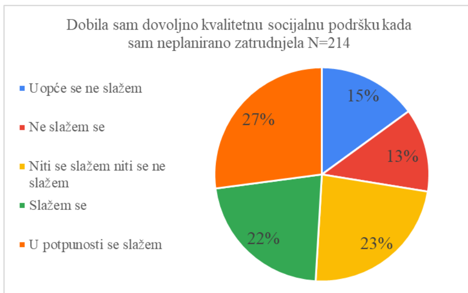
Slika 1. Samoprocjena kvalitete socijalne podrške

Peta hipoteza je djelomično potvrđena jer je u najvećem broju slučajeva ispitanicama izvor socijalne podrške u neplaniranoj trudnoći bio/la partner/ica i obitelj, a ne partner/ica i prijatelji (Slika 2).