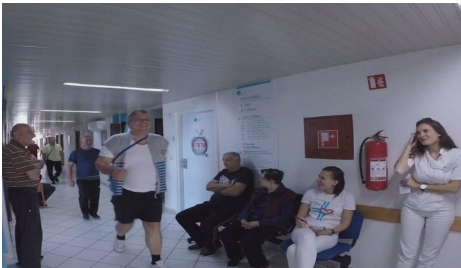
Slika 2 6MWT u ustanovi za kardiološku rehabilitaciju Thalassotherapia Opatija.

Na Slici 2 prikazana je provedba 6MWT u ustanovi za kardiološku rehabilitaciju Thalassotherapia Opatija.