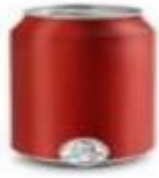
Limenka/boca oko 330 ml (12 oz)

Molim Vas označite koliko porcija gaziranog pića u prosjeku konzumirate tjedno. Neka gazirana pića ne sadrže kofein. Primjer: Sprite, 7-Up, gazirani sokovi od naranče, itd