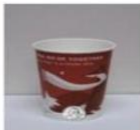
Šalica oko 350 ml (12 oz)