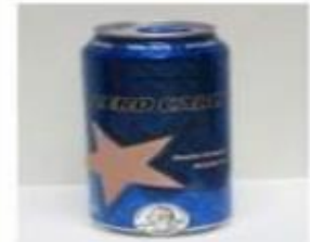
Limenka/boca oko 500 ml (18 oz)

Konzumirate li čaj najmanje jednom tjedno?