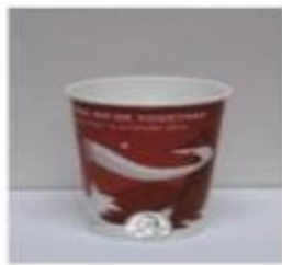
Mala kava, oko 350 ml (12 oz)