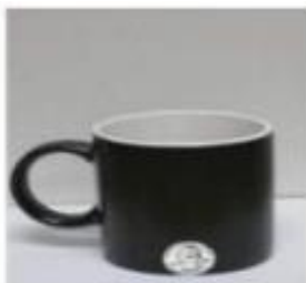
Šalica oko 250 ml (8 oz)

Molim Vas označite koliko porcija čaja u prosjeku konzumirate tjedno.