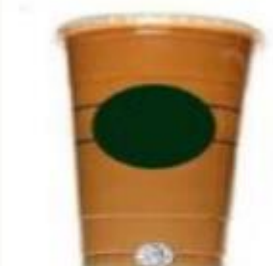
Jako velika ledena kava oko 900 ml (31 oz)

Konzumirate li gazirana pića najmanje jednom tjedno?