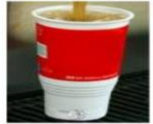
Limenka/boca oko 1 L (32 oz)

Konzumirate li energetska pića najmanje jednom tjedno?