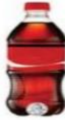
Limenka/boca oko 600 ml (20 oz)