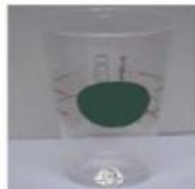
Velika ledena kava, oko 600 ml (20 oz)