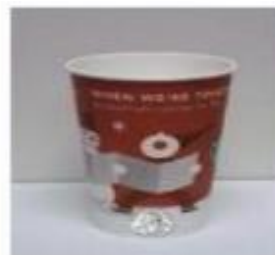
Šalica oko 500 ml (16 oz)