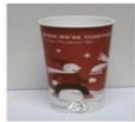
Velika kava, oko 600 ml (20 oz)

Molim Vas označite koliko porcija ledene kave u prosjeku konzumirate tjedno.