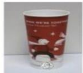
Šalica oko 600 ml (20 oz)