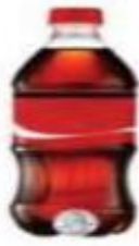
Limenka/boca oko 500 ml (16,9 oz)