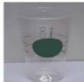
Srednje velika ledena kava, oko 500 ml (16 oz)