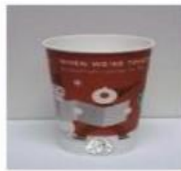
Srednje velika kava, oko 500 ml (16 oz)