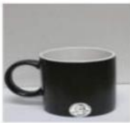
Kratka kava, oko 250 ml (8 oz)

Molim Vas označite koliko porcija kave u prosjeku konzumirate tjedno?