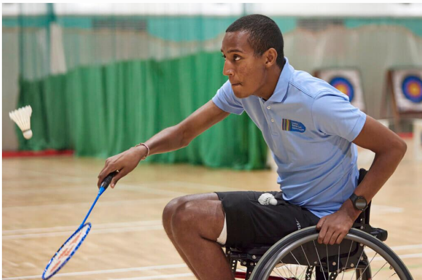
Slika 6. Parabadminton.

Parabadminton je podijeljen u šest kategorija prema stupnju tjelesnog invaliditeta sportaša te se svaki igrač badmintona mora klasificirati prije međunarodnog natjecanja. Može se igrati u invalidskim kolicima i kao takav namijenjen je sportašima s invaliditetom donjih ekstremiteta odnosno za sportaše koji za kretanje koriste invalidska kolica. Tijekom njihove igre visina mreže i dimenzije terena za badminton prilagođeni su za igru u invalidskim kolicima. Stojeći badminton mogu igrati i sportaši s invaliditetom gornjih ekstremiteta. Sportaši sa takvim oštećenjem tijekom igre koriste prilagođene rekete (57).