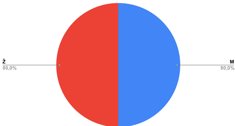
Slika 2. Grafikon ilustrira distribuciju sudionika prema spolu.

U istraživanju su sudjelovali studenti prve, druge i treće godine preddiplomskog studija fizioterapije. Sljedeći grafikon prikazuje njihovu distribuciju po godinama (Slika 3.).