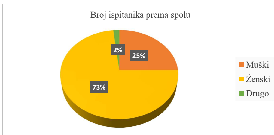
Slika 2. Broj ispitanika prema spolu