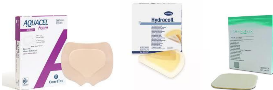
Slika 3. Vrste koloidnih obloga