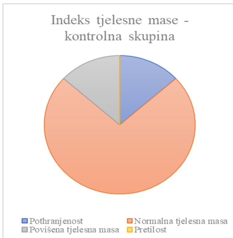
Slika 1. Dijagram ITM-a – kontrolna skupina